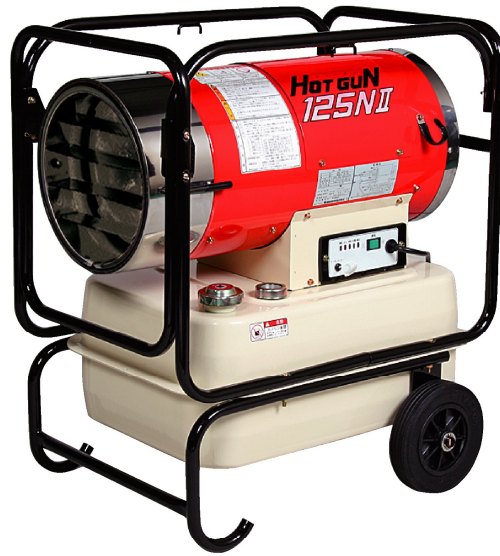
ジェットヒーター 125N (写真は125N )